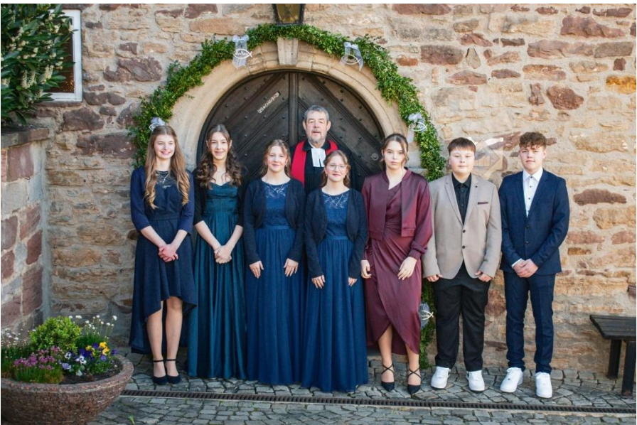
Konfirmation in Mansbach Konfirmation in Buchenau s. S. 27!