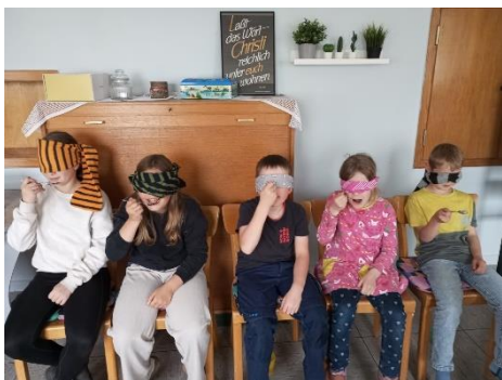
Jungchar in Erdmannrode

Nun sind zwei Jahre vergangen, in denen ich in unserem Kooperationsraum, vorrangig in den Kirchengemeinden Eiterfeld-Rasdorf und Buchenau, in der Kinder- und Jugendarbeit tätig sein durfte. Zunächst war die Stelle für ein Jahr als Praktikum im Rahmen meines Studiums angedacht. Letzten Endes sind es zwei geworden, auf die ich gemeinsam mit Euch nun Rückblick halten möchte: