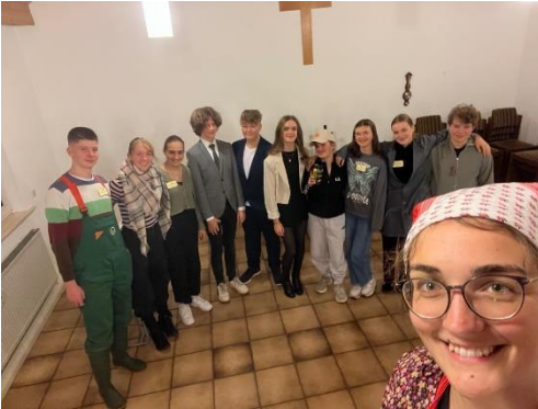
Krimidinner in der Jugendgruppe

meinden erlebt. Dafür bin ich sehr dankbar. Auch für mich persönlich habe ich Kirche noch einmal ganz neu zu schätzen gelernt –die Art und Weise, wie Gemeinde bei uns gelebt wird und die Menschen, die unsere Kirche ausmachen.