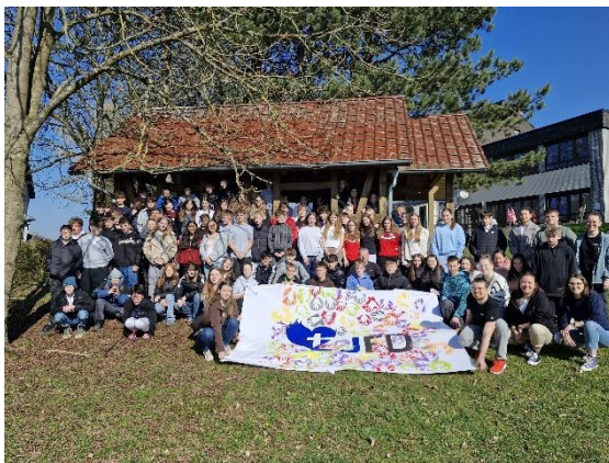
Konficamp in Neukirchen/Knüll

Für mich waren die letzten zwei Jahre gefüllt mit verschiedenen Gruppenangeboten – wie Jungchar in Erdmannrode, Kindergottesdienst in Eiterfeld, Jugendtreff in Buchenau und den Konfirmandenunterricht - sowie einmalige Ereignisse – z.B. Kinderbibeltage, Teenfreizeit, Kanufreizeit und gemeinsam gestaltete (Familien-)Gottesdienste. Besonders habe ich es genossen, gemeinsam mit anderen Mitarbeitenden im Team zu arbeiten. Außerdem hat mir die abwechslungsreiche Arbeit und die Begegnungen mit den Kindern, Jugendlichen und Erwachsenen Freude bereitet.