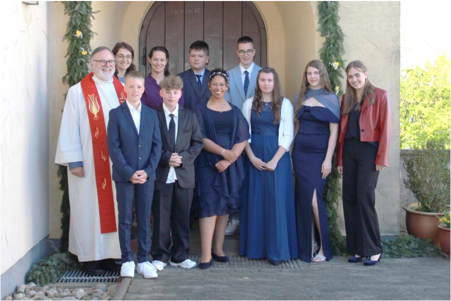
Konfirmation in Eiterfeld