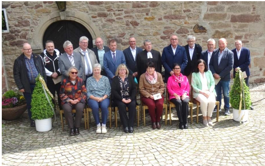
Goldene Konfirmation in Mansbach