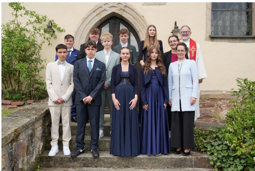
Konfirmation in Buchenau